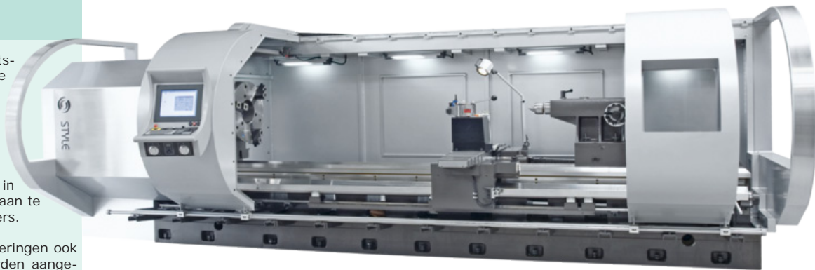
Nieuwe Style-1100 draaibank

Wegens een stijgende vraag van draaiwerk, sleeplinglichamen en kroezen heeft Lückerath enkele maanden geleden besloten om deze in eigen beheer uit te voeren. Met de aanschaf van een tweetal nieuwe machines en de opleiding van enkele medewerkers zijn wij in staat om alle draai- en freeswerken zelf uit te voeren.