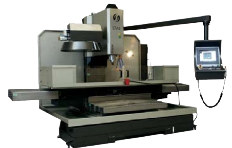
CNC Freesmachine Style

Wenst u meer technische gegevens te ontvangen? Gelieve ons dan te contacteren via info@Luckerath.com of kijk op onze website voor meer technische informatie.